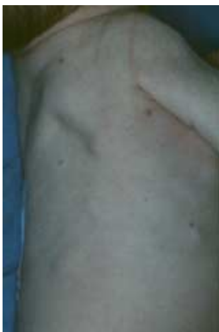
Fig. 3. Myofibromatose infantile dans sa forme diffuse. Les lésions cutanées sont parfois difficiles à différencier des hémangiomes, mais leur consistance est plus ferme. En cas de doute, une biopsie permet de redresser le diagnostic.

Dans ce cas également, c'est la biopsie hépatique qui fera le diagnostic.