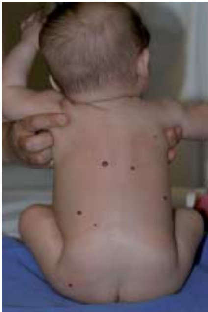
Fig. 1. Hémangiomatose cutanée bénigne.