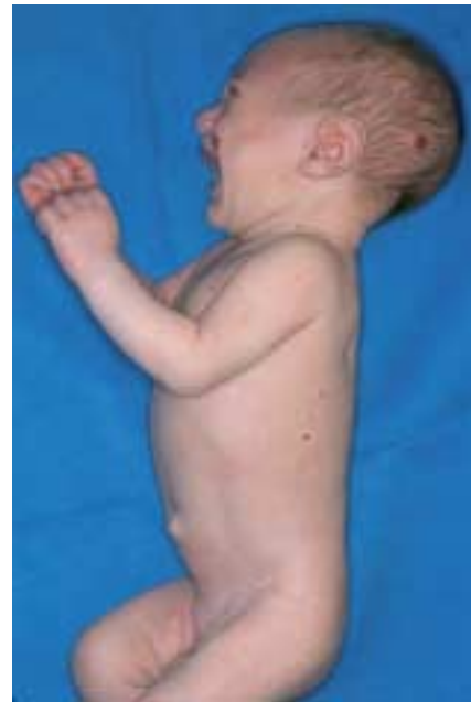
Fig. 2. Hémangiomatose miliaire chez un nourrisson ayant des hémangiomes hépatiques. Les hémangiomes sont de taille variable, de quelques millimètres à 1 ou 2 cm, souvent entourés d'un halo anémique.

– L'hémangiome focal : l'hémangiome hépatique focal est souvent diagnostiqué lors d'une échographie anténatale, devant une tumeur vasculaire à haut-débit (présence de shunts artério-veineux (AV) ou porto-veineux (PV)), parfois compliquée d'insuffisance cardiaque. L'hémangiome focal est apparenté au RICH ( Rapidly Involuting Congenital Hemangioma ) ; à la biopsie il est GLUT-1 (marqueur des hémangiomes infantiles) négatif et son involution est spontanée et rapide. Dans ce cas, il n'y a pas d'hémangiomatose cutanée.