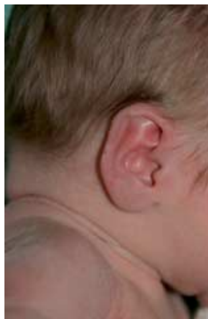
Fig. 4. Pseudo-angiomatose éruptive. Les lésions sont d'apparition rapide, mesurent de 1 à 3 mm, et régressent spontanément en quelques jours.

En cas d'échec des corticoïdes, deux options sont proposées : soit l'interféron alfa-2a, soit la vincristine. L'interféron est administré en injection intra-musculaire ou sous-cutanée,