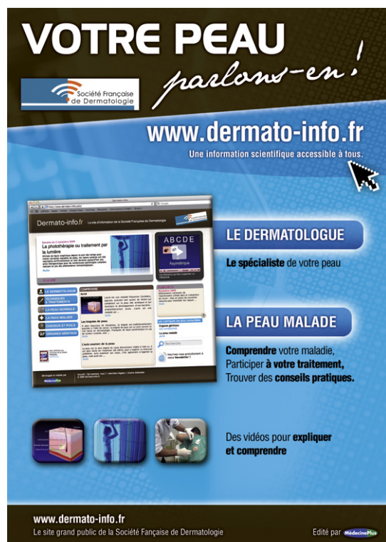
Figure 1. Affiche promotionnelle du site grand public de la Société française de dermatologie.

La Haute Autorité de Santé, dont le souhait est de promouvoir une information de qualité sur le net et d'aider les patients à identifier des sites de santé fiables, invite les professionnels à les guider dans leur choix.